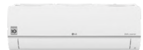
Standard Plus Wi-Fi R32 DUAL Inverter Google Assistant