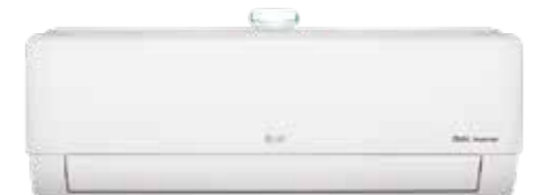
Air Purification Wi-Fi R32 DUAL Inverter Google Assistant