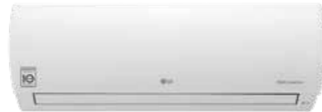
Prestige Wi-Fi R32 DUAL Inverter Google Assistant