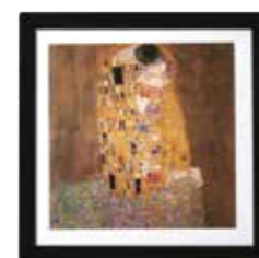
ARTCOOL Gallery Wi-Fi R32 DUAL Inverter Google Assistant