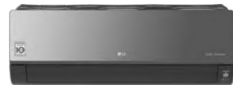
ARTCOOL Mirror Wi-Fi R32 DUAL Inverter Google Assistant