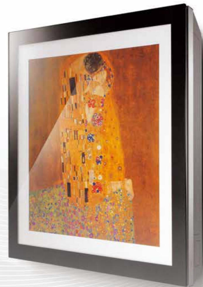
ARTCOOL Gallery R32 Wi-Fi DUAL Inverter Google Assistant

LG vous offre un confort optimal et une excellente qualité d'air, toute l'année