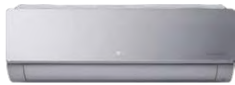
ARTCOOL Silver Wi-Fi R32 DUAL Inverter Google Assistant